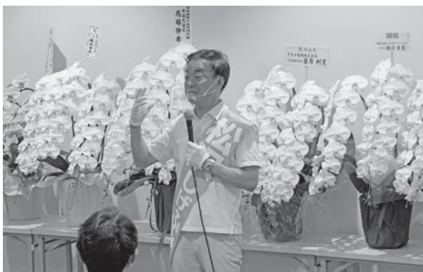
松沢 成文 参議院議員