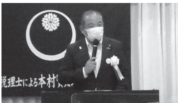
本村賢太郎相模原市長