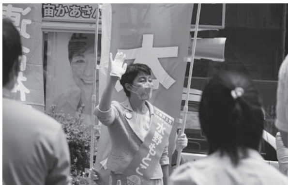
水野もともこ 参議院議員