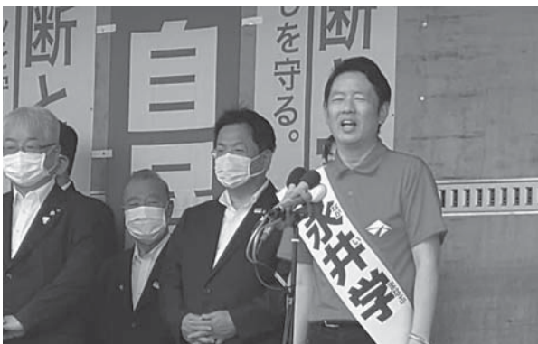
永井 学 参議院議員