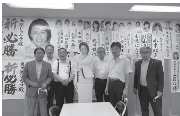
三原じゅん子 選挙事務所