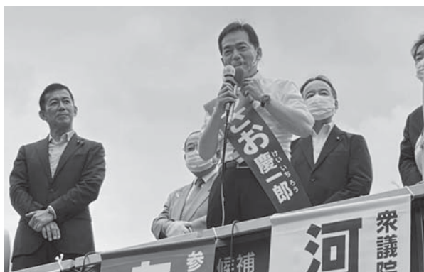
浅尾慶一郎 参議院議員