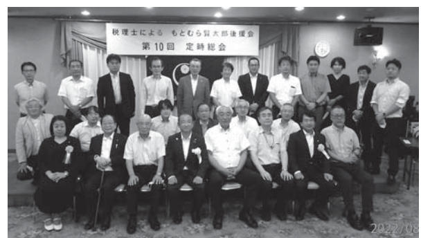
本村市長を囲んで