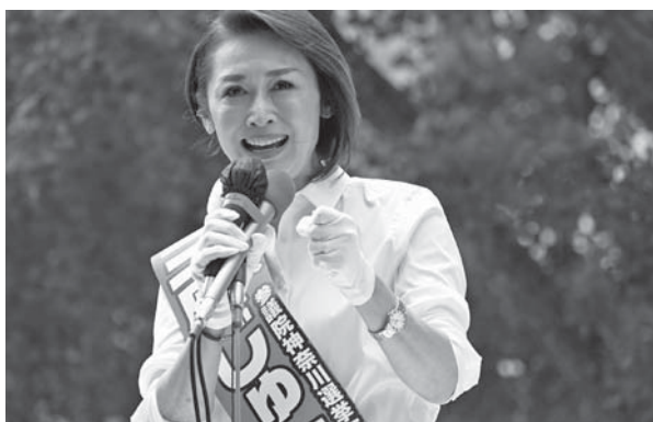
三原じゅん子 参議院議員