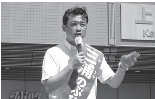
三浦のぶひろ 参議院議員